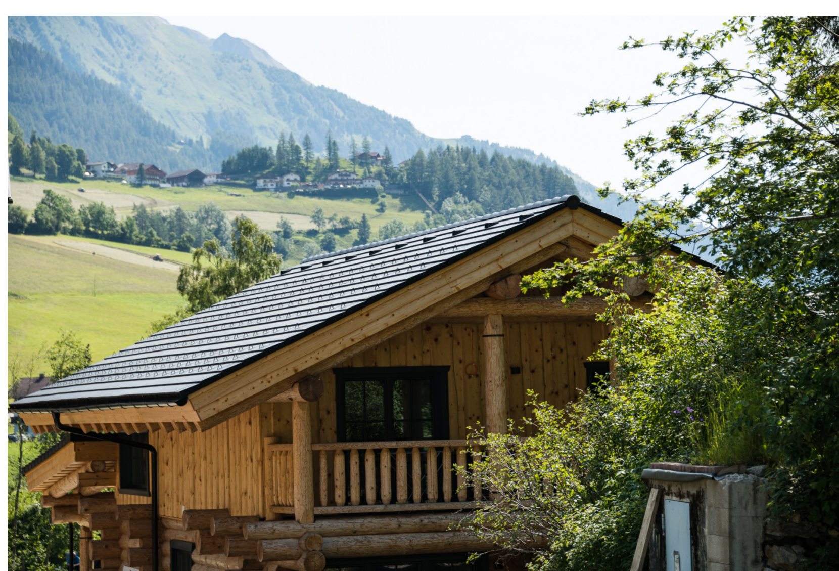
Berghütte im Blockhausstil in den Alpen

Urlaub in den Alpen wird zunehmend beliebter