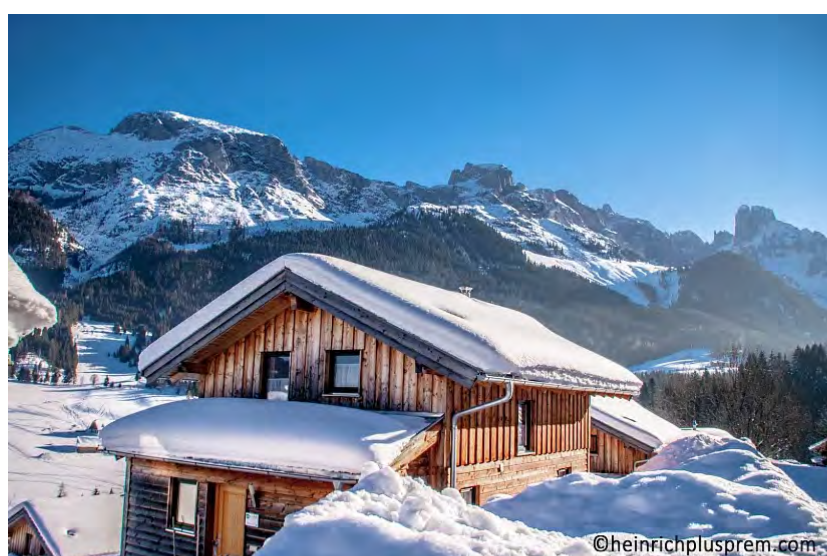
ALPS Residence | Alpendorf Dachstein West